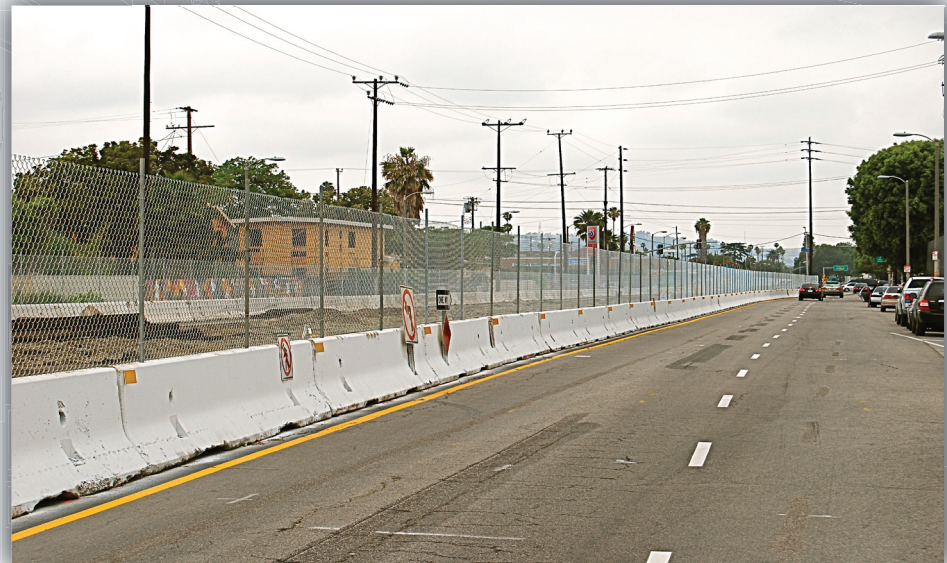
K-Rail currently along the Exposition ROW in the Mid-Corridor.

Monday - Friday, 7:00 a.m. - 9:00 p.m. If construction needs to take place overnight or during a weekend, the community will be notified in a timely manner.